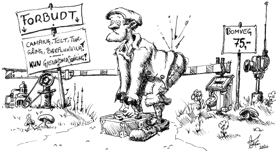
Til venstre: Grunneier og Sauebonde Yngstein Utmark fotografert i det øyeblikket ryggen smeller til.